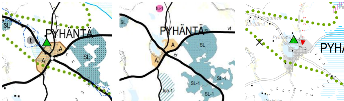
Otteet voimassa olevista maakuntakaavoista. Vas. lukien Pohjois-Pohjanmaan maakuntakaava, 1. vaihemaakuntakaava ja 2. vaihemaakuntakaava.

3. vaihemaakuntakaava on tullut vireille vuonna 2016 ja siinä käsiteltävät teemat ovat mm. pohjavesi- ja kiviaines-, mineraalipotentiali- ja kaivosalueet, tuulivoima-alueiden tarkistukset ja muut maakuntakaava-merkintöjen päivitykset.