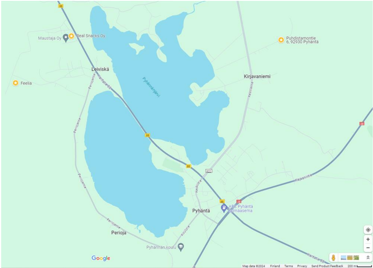
Kuva 2. Leiviskänkankaan teollisuusalueen, Pyhäntän kunnan keskustan ja esikäsittelylaitoksen sijainnit kartalla. Lähde: google.com/maps (16.4.2024)