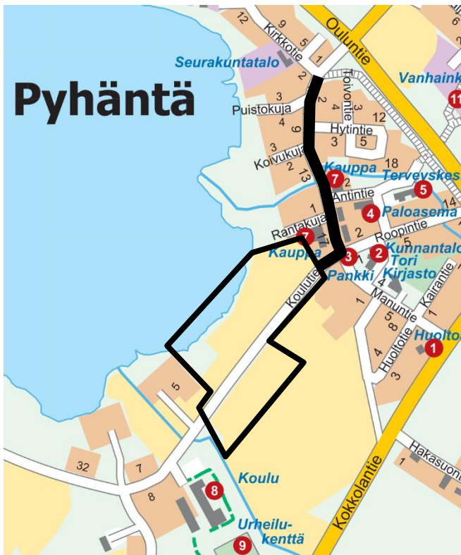
Kaavamuutosalueen sijainti ja alustava raja

Suunnittelualueena on Koulutien varren ympäristöä koulun ja keskustan välissä olevilla peltoalueilla ja Pyhännän keskustassa sijaitseva Keskustien tiealue.